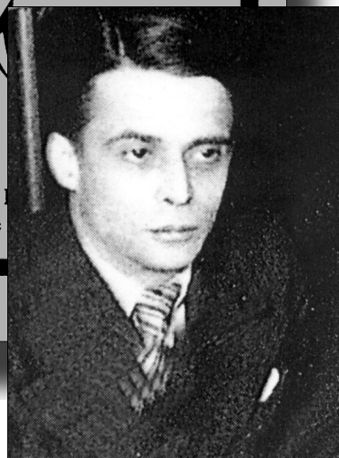
Перикл Ставров, 1934 г.

час и совсем неизвестные страницы жизни людей, с которыми был знаком лично. Но самое главное, конечно, — поэтическое наследие, эти дышащие жизнью, энергией и прекрасным русским языком стихи.