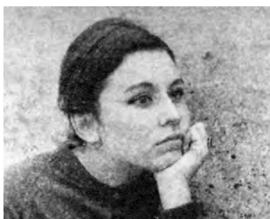
Рита. 1962 г.

В марте нынешнего года Музей современного искусства Одессы совместно со Всемирным клубом одесситов при поддержке АБ «Пивденный» представили проект «Муза Одессы», вызвавший широкий и живой интерес у художников, критиков и любителей изобразительного искусства.