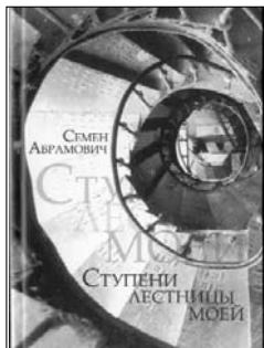
Семен АБРАМОВИЧ Ступени лестницы моей Одесса, Астропринт, 2007

Я бы сказал, что для прозы эта книга перенасыщена поэтическими тропами, но автор и не собирался писать психологическую прозу. Как он дышит, так и пишет, не пытаясь угодить. Поэтому его книги пользуются большим читательским спросом, вызывают интерес к нашему городу и к личности автора.