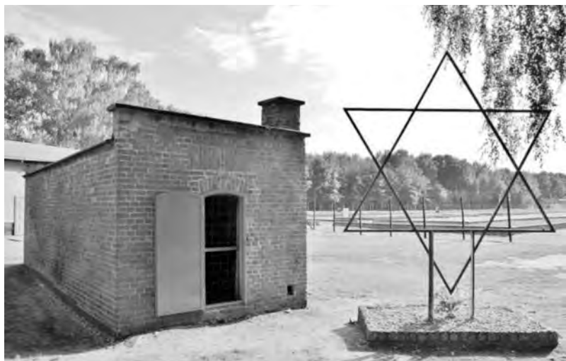
Газовая камера и крематорий территории Мемориала концлагеря Штуттгоф, 2017 г.

В графе этого документа указано, что он Pole/Jude/Russe (поляк/еврей/русский), и номер регистрации при доставке.