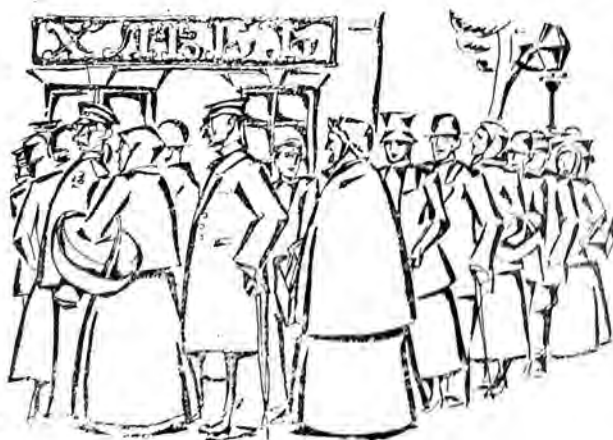
Очередь за хлѣбомъ.

Зарисовки съ натуры для „Огоньковъ“ худ. Скиф.