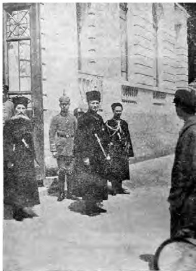
Гетмань Украины П. Скоропадский у дворца.