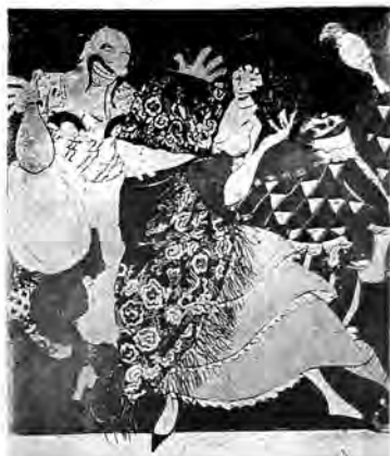
Распись театра. Фрагментъ панно „Карнавальное шествіе“.