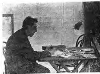
Академикъ Д. Н. Овсенико-Кузиковскій.