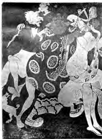
Распись театра. Фрагментъ панно главного зала „Карнавальное шествіе“.

Будущій театральный сезонъ будетъ чрезвычайно обогащенъ этого рода искусствомъ. Расписываются цѣлые театры, въ которыхъ