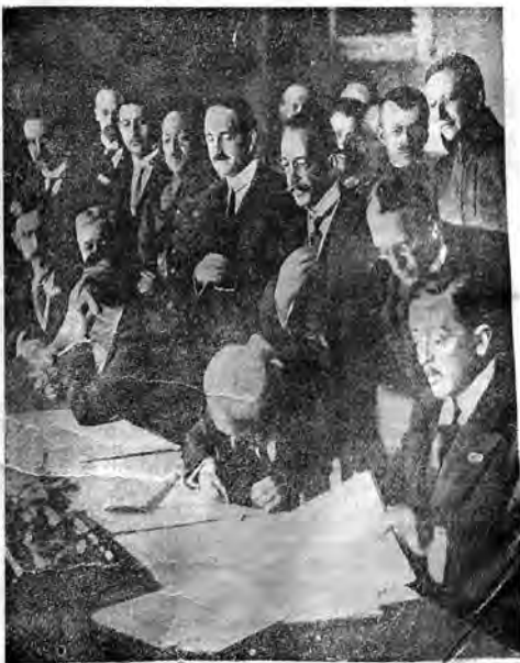
Подписаніе мирнаго договора въ Бухарестѣ.