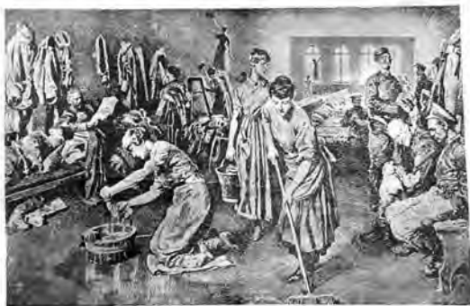
Дамы высшаго общества, заняты уборной казармъ красногвардейцевъ.