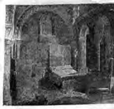
Интерьеръ Натроченіи, въ которомъ происходили мирные переговоры съ Румыніей. Будуаръ королевъ.