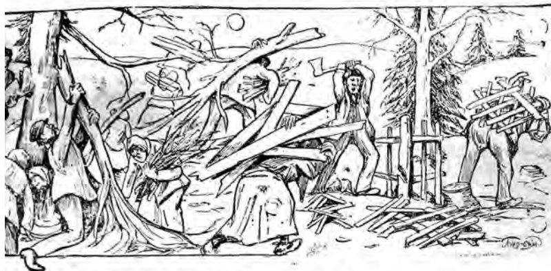
Рубка населеніемъ ботаническаго сада.