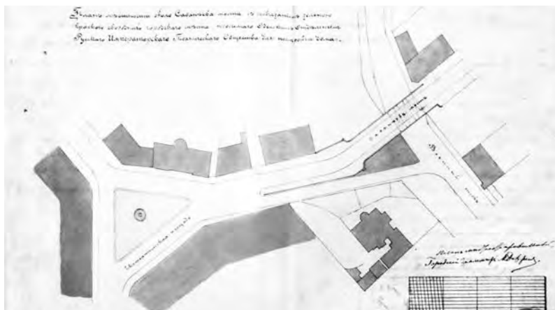
Выкопировка плана местности у Сабанеева моста с показанием участка, одобренного для выделения ООИРТО (выделено зеленым)

– 7 июля. Городская управа письмом в правление ООИРТО сообщает об изменившихся границах отведенного участка и спрашивает, согласно ли общество принять на себя замощение тротуара и перенос газового фонаря.