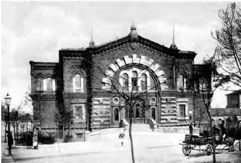
Здание Одесского отделения Императорского Русского технического общества

него сгорания, с появлением новых материалов в строительстве и т. д. и т. п. остро встала необходимость создание некой структуры, которая могла бы выступить в роли своеобразного медиатора между достижениями прогресса и науки и теми, кто должен их применять на практике, – предпринимателями, властью и обществом. Такой структурой и стало Русское техническое общество.