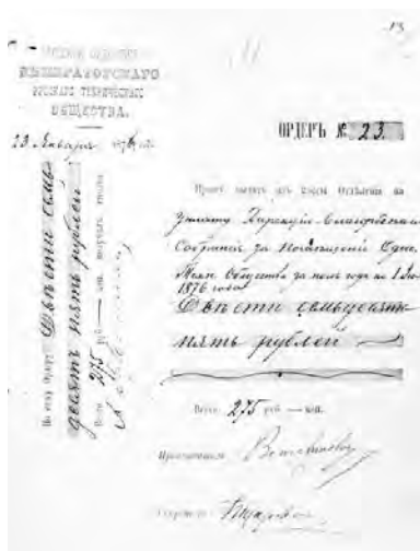
Документы об арендной плате за помещения в здании Благородного собрания за 1876 год

Первоначально ООИРТО располагалась в нанятом помещении при одесском Благородном собрании, конкретно – в библиотеке Благородного собрания; это здание не сохранилось. Находилось оно на Садовой, на месте его позднее был построен Главпочтамт. Аренда помещений стоила 275 рублей в год, о чем сохранились соответствующие чеки (1876).*** Затем общество снимало помещения при управлении Одесского участка железных дорог, позднее Юго-Западных железных дорог; в последующее время – в помещении