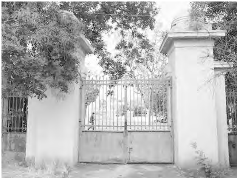
Ворота астрономической обсерватории сегодня.

К сожалению, проект так и остался нереализованным – не прекращались споры с городскими властями по территории, разгоралась война, отнимавшая и силы, и ресурсы.