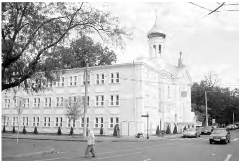
Стурдзовская церковь. Одесса.