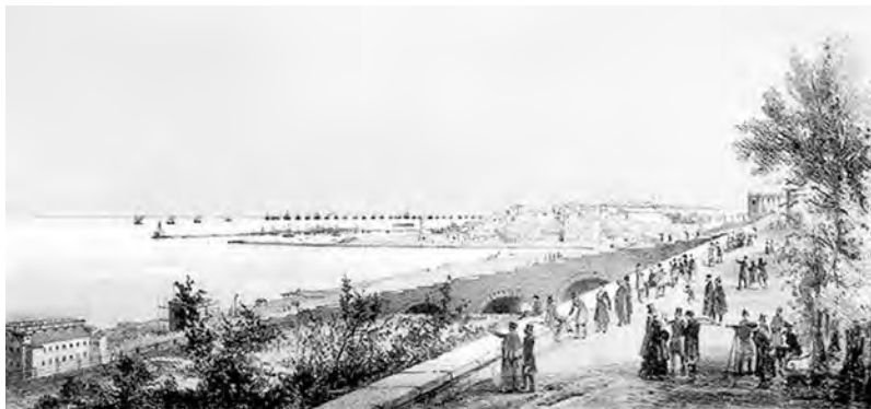
Приморский бульвар в середине XIX ст.

К лету 1821 года относится и печальное событие: первый в Одессе еврейский погром. Поводом послужила доставка из Стамбула и торжественное захоронение в пределах греческой Свято-Троицкой церкви тела казненного турецкой администрацией константинопольского патриарха Григория V. Просочились слухи, будто тамошние евреи глумились над растерзанным телом праведника. По счастью, погром обошелся без жертв, существенных разрушений, и быстро угас. Среди подлинных причин конфликта называют торговую конкуренцию греческой и еврейской общин. Это представляется маловероятным для той эпохи: численность еврейских купцов 1-й гильдии, как и капиталы еврейского общества в целом на порядок ниже, чем греческого, и даже 10-15 лет спустя мы не видим еврейских фамилий в перечне главных экспортеров сельхозпродукции.