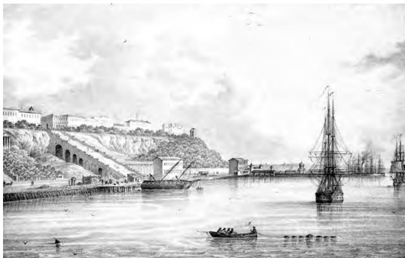
Одесская гавань и в середине XIX ст.

11) «разбивка и разравнивание на площадке 30 сажень щепня, высыпка 306 квадратных сажень площадки, подвозка, разброска, выравнивание по 3-м аллеям и посыпка 3-х аллей гравием»; 12) «забутовка для тротуара фундамента – 146 квадратных сажень»; 13) «сделание тротуара на 220 сажень шириной 2 аршина плитным камнем». Общая сметная стоимость составила 22.063 руб. 90 коп. Определили: отдать работу в подряд, торги назначить на 15, 19, 22 марта. 578