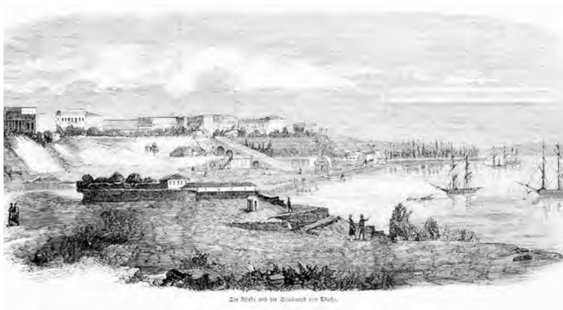
Приморская часть города после постройки Бульварной лестницы

Вот так я закрыл долго мучивший меня вопрос о том, на что пошел камень от разборки Екатерининского храма . Все просто: на казенные строения и работы по благоустройству, скажем, штучковый камень – на устройство дренажных сооружений по Карантинной балке. Другая часть материала, а именно плитчатый, т. н. звонкий известняк-дикарь, использовалась И.И. Кругом для постройки собственного дома в будущем Воронцовском переулке. К этому сюжету мы еще вернемся.