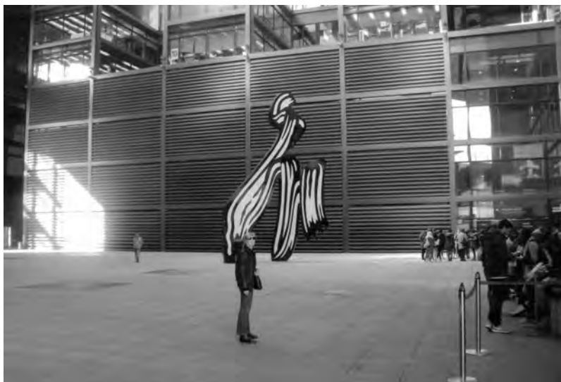
У входа в Музей королевы Софии всегда очереди