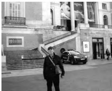
Наконец-то иду в Прадо!

Вообще, множество печальных, а то и жутких событий случились осенью 2015 года, и почти сразу после нашего похода