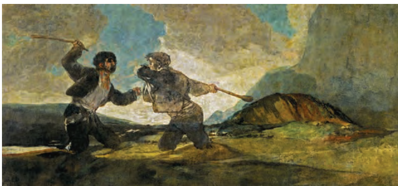
Франсиско Гойя. «Драка». 1823 г.