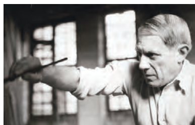
Пабло Пикассо. «Герника» и эскизы к ней. 1937 г.