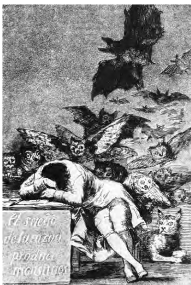
Франсиско Гойя. «Сон разума рождает чудовищ». Офорт. 1790-е гг.