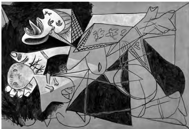
Пабло Пикассо. Эскиз к картине «Герника». 1937 г.

В нынешние свои годы я как бы заново открыл для себя не парадного, не чувственного, не драматичного, а Темного Гойю, создавшего к концу жизни цикл Мрачных картин. Так их определили