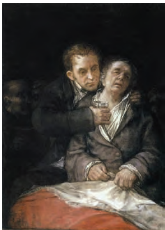
Франсиско Гойя. Автопортрет с доктором Аррьета. 1820 г.