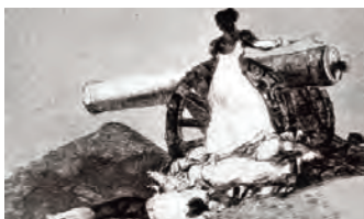
«Бедствия войны». Офорт