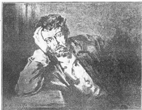
СУМАСШЕДИШІЙ. Рисунок Н. К. Алексеевича.