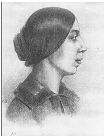
Полина Виардо-Тарсина Литография Р. Р. с ее автопортрета Конец 1840-х гг.

Къ семейной жизни Тургеневъ питалъ весьма сильную любовь; онъ называлъ ее "главнымъ кушемъ въ жизненной лоттерей" и видѣлъ въ ней достаточную гарантію для личнаго спокойствія. Старающъ въ письмахъ 1870 г. разсѣять пессимизмъ Писемскаго, Тургеневъ пишетъ ему, чтобы онъ не забывалъ, что выигралъ главный кушъ въ жизненной лоттерей, — именно: имѣть прекраснѣйшую жену и славныхъ дѣтей. "Стало быть, — заключаетъ онъ, — хандрить-то и не слѣдуетъ".