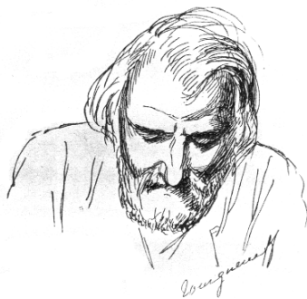
И. С. Тургенев Рисунок П. Віардо. 1879

Заграницей Тургеневъ пробылъ съ конца 1840 г. и по конецъ 1850 года. Въ этомъ году, по случаю смерти матери, онъ вернулся въ Россію и почти все время, до конца 1856 г., прожилъ въ деревнѣ, куда былъ высланъ за статью на смерть Гоголя. Въ 1856 году онъ снова уѣхалъ за границу и оставался тамъ до самой смерти, причемъ, вторичный отъѣздъ его Некрасовъ напутствовалъ слѣдующимъ стихотвореніемъ.