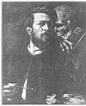
АВТО-ПОРТРЕТЪ КРАМЛИНИНА А. БОКЛОВА.