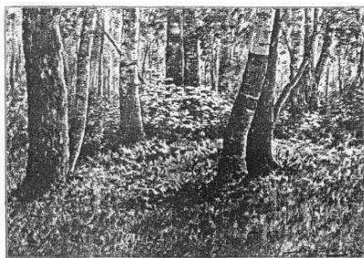
ЛѢСЪ. Рисун. В. Х. Байра.