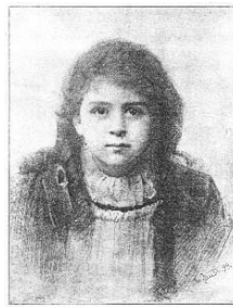
ГОЛОВА. РИСУНОКЪ. Рисун. В. И. Дина.