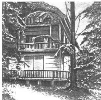
Шале И.С. Тургенева в Буживалѣ

Ни одно крупное произведение Тургенева не проходило без того, чтобы по адресу автора не было послано множества упреков и на счет пребывания его за границей, и на счет незнания жизни родины, и смелости, с которой он берет за художественное воспроизведение общественных явлений и т. п., — не говоря уже об упреках в разных "измѣнах". Все такіе нападки сильно влияли на Тургенева и отражались в письмах его къ друзьямъ въ формѣ какой то унылости. Рядомъ съ тѣмъ въ нихъ сказывалось и раздраженіе. Тургеневъ терялъ иногда самообладаніе, называя критику "лаемъ мальчишекъ". Но если изъ всего этого выдѣлить временное, возникавшее подъ влияніемъ минутныхъ обстоятельствъ, то все-таки нельзя не подмѣтить въ унылости Тургенева и нѣчто постоянное и дѣйствительно серьезное.