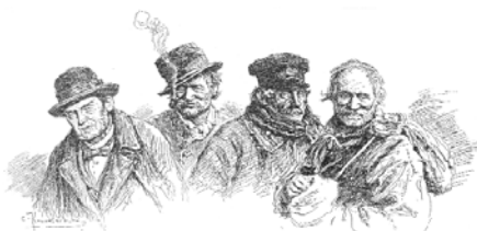
ТИПЫ. Рисунок С. В. Ковалевскаго.