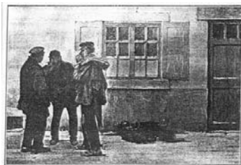
ВООРУЖЕН. Рисунок Н. Н. Давыдова.