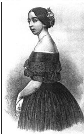
Полина Виардо-Гарсиа Рисунок В. Тимма. 1853

Но всегда-ли Тургеневъ пользовался спокойно и увѣренно такимъ именно сознаніемъ? — вотъ вопросъ, который не можетъ быть обойденъ молчаніемъ, когда заходитъ рѣчь о его одиночествѣ.