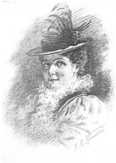
ПАРИЖАНКА. Рису. В. В. Коренев.