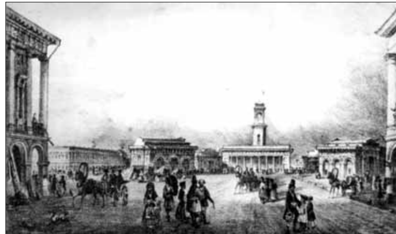
Площадь Старого базара

Но почему процветающий купец принял на себя столь мало отвечающую его роду занятий должность американского консула, остается только гадать. Думается, что одно из правильных объяснений дает нам американский путешественник, посетивший Одессу в 30-х гг.: "Мистер Ралли — богатый и респектабельный, будучи вице-президентом торговой биржи, очень горд честью быть американским консулом, так как это дает ему место среди сановников города, позволяя носить униформу и шпагу на общест-