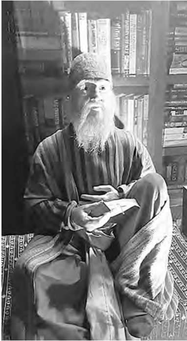
Махмуд аль Кашгари

с типичной казацкой сечью*. Подобная сечь – Берладская – известна еще в XII в. на Нижнем Дунае.** А в XVII-XVIII вв. на Днепре и Днестре так было обустроено множество казацких паланок (тур.: palanka – форт, редут, палисадное укрепление).