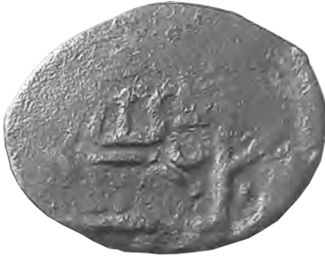
Монета Менгли-Гирея Орду-Базар