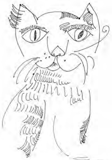
Степан Рябченко. Портрет кота. 29,7×21 см, бумага, перманентный маркер. 2015 г.

Творческую манеру Степана, цветовую палитру его работ наши читатели уже видели – на обложке восьмьдесят восьмого номера нашего альманаха и в иллюстрациях к моей статье, в которой рассказывалось о том, что наш земляк по итогам вернисажа на «Экспо-2020» (Дубай) вошел в десятку самых перспективных современных молодых цифровых графиков мира. Именно графиков: и карандаш, и перо, и резец деда, Сергея Васильевича, и компьютеры внука – Степана Васильевича, – рабочие инструменты современного художника-графика. Уверен: эта тема, возникающая в дискуссиях об