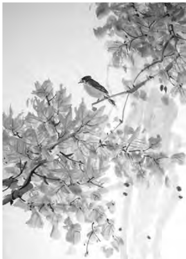
Вера Рябченко. Птичка в кленовых листьях. 68x46 см, бумага, тушь, перо. 2019 г.

Сегодня мне, послевоенному пацанчику, захотелось назвать моих друзей именно так.