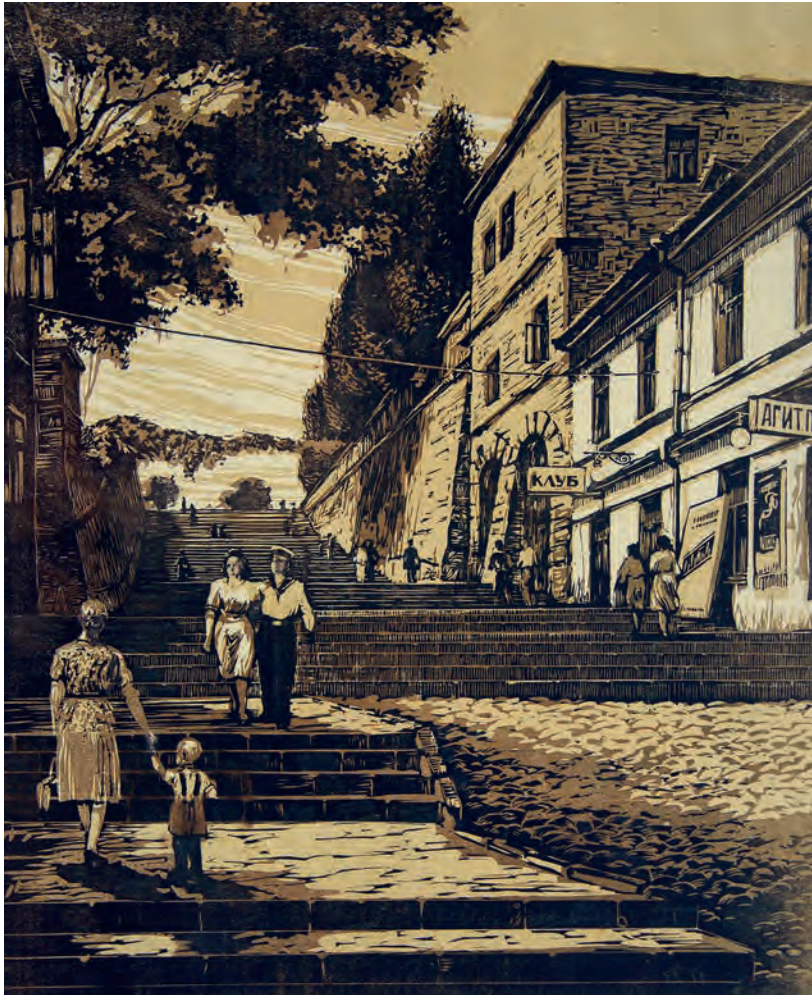
Сергей Рябченко. Спуск Ласточкина. 38,5x45,9 см, бумага, цветная линогравюра. Начало 1950-х гг.