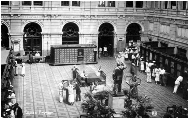
Главпочтамт, операционный зал. Обратите внимание: все мужчины в белых штанах, как в Рио-де-Жанейро, городе-мечте Остапа Бендера