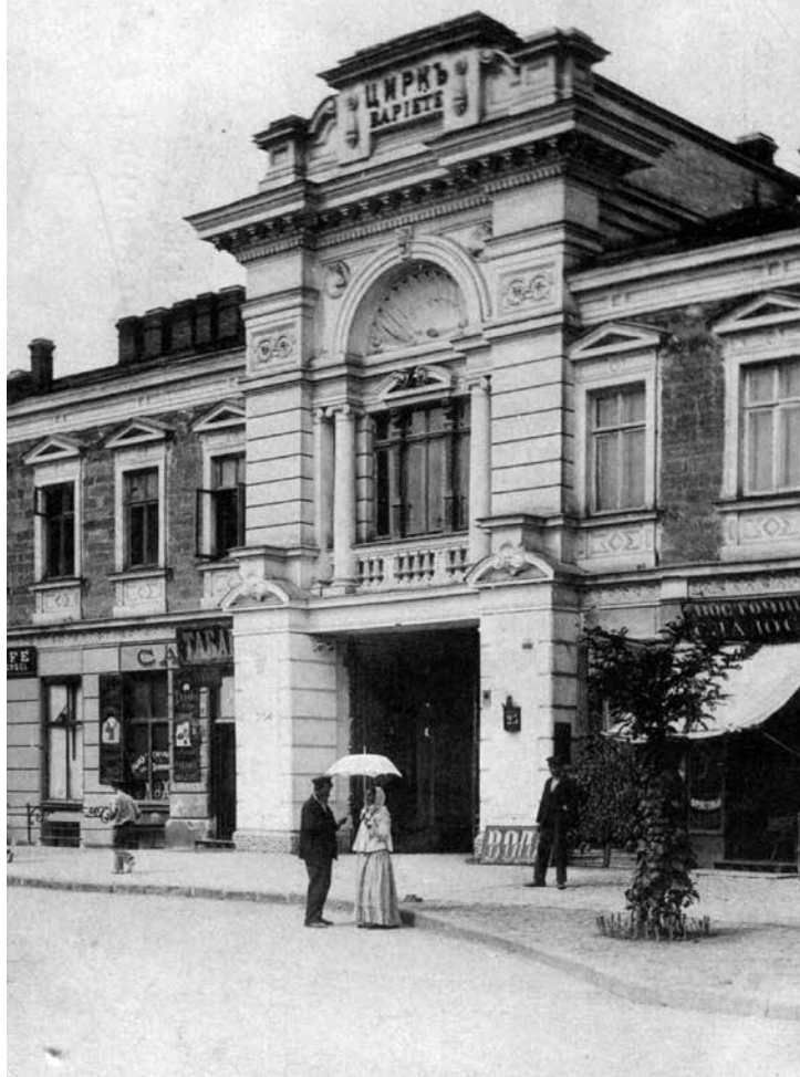
Цирк. Парадный вход с Коблевской (много лет была – Подбельского)

ОДЕССА. — ODESSA. № 138. Циркъ „Варьете“. — Cirque „Varieté“.