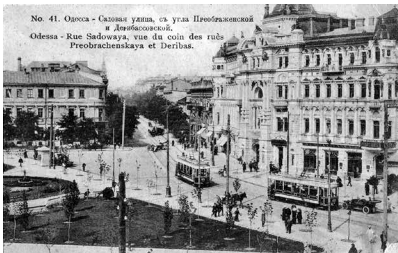
No. 41. Одесса - Садовая улица, съ угла Преображенской и Дерибассовской. Odessa - Rue Sadowaya, vue du coin des ruès Preobrachenskaya et Deribas.