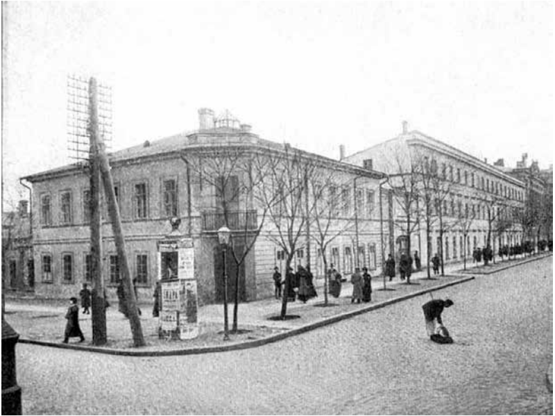
Садовая угол Торговой. Легендарное здание Ришельевского лицея (после ухода с Дерибасовской), затем гимназия. После войны – Военно-морское медицинское училище