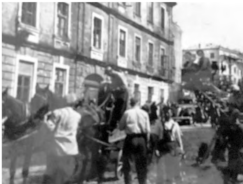
На съемках фильма «Зеленый фургон». Одесса. 1959.

Александр Баршай в статье «Габай – Баршай – Мартинсон» писал: «Долгое время чиновники в Госкино считали фамилию Габай украинской и позволяли режиссеру относительно спокойно работать. Но когда поняли, что их «обманули», Генриха стали прижимать и давить так, что он вынужден был подать документы на выезд в Израиль. И тогда все его фильмы сняли с проката, на имя наложили табу, а самого мастера напрочь лишили какой-либо творческой работы». Последний фильм Генриха Габая, «Без трех минут ровно», вышел в год отъезда из СССР.