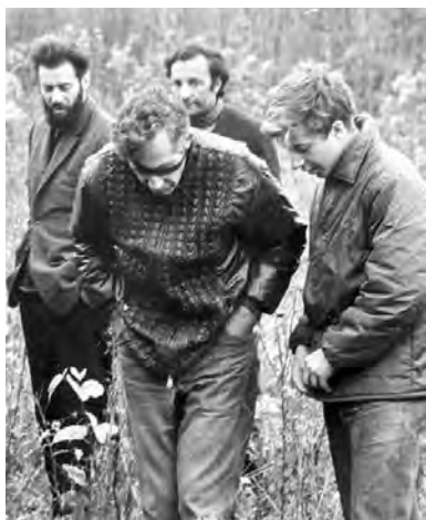
На съемках фильма «Время счастливых находок». 1969 г.