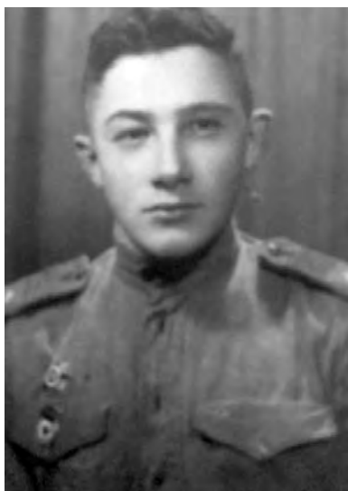
В 1945 г.