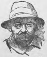
Публикация Центрального Комитета Рабочих Газет тов. Г. Петровскаго