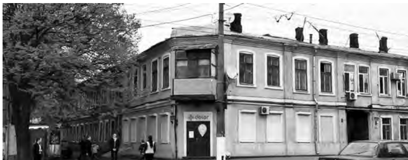
Театральный зал в доме Корбула на углу Мельничной и Михайловских улиц (современный вид)

вокзала театре. При этом комитет предоставлял список 25-ти пьес, доступных пониманию простолюдинов. Поскольку сезон уже наступил, председатель просил ускорить рассмотрение списка, так как спектакли являются весьма желательны.