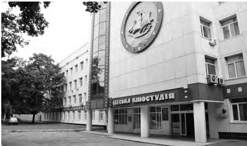
Одесская киностудия (современный вид)