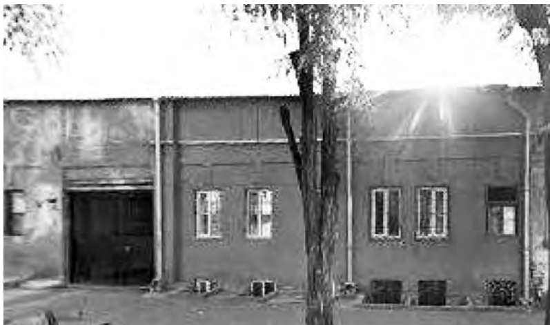
Киностудия на Дидрихсона, 17. (современный вид здания)