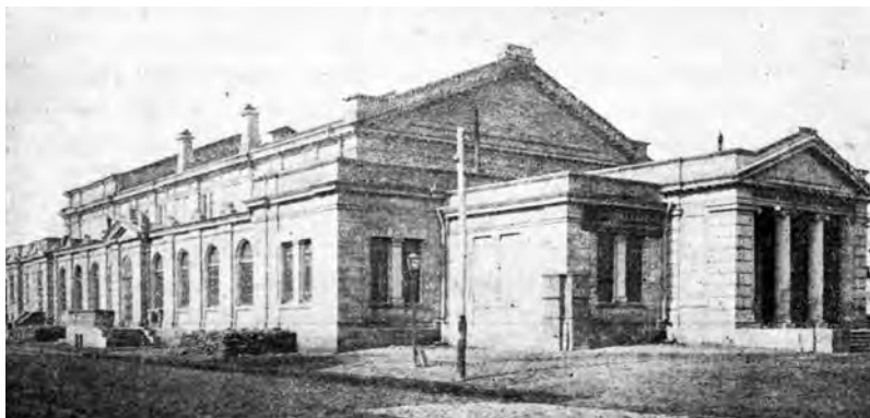
Здание народной аудитории (кинотеатр «Родина»)

В «Одесском вестнике» писалось: «7 февраля после реконструкции при вновь сформированной труппе из актеров и любителей драматического искусства поставлена 4-актная драма Александра Островского «Грех да беда на кого не живет» с заключительным дивертисментом».