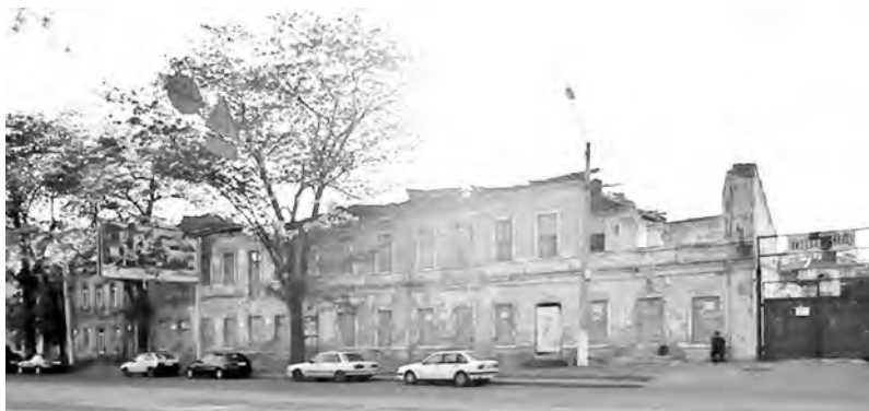
Прохоровская, 48. Здание иллюзиона «Прохоровский» (современный вид)

прежде всего, усовершенствовать сам процесс кинопоказа. При чем в качестве эталона обустройства зрительного зала приводился именно иллюзион «Прохоровский» на одноименной улице.