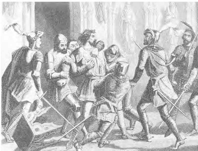
Арест Бернара де Рокафорта

«Но дело, как видно, было не угодно Богу, – пишет Григора, – и кончилось несчастным образом». Свирепая жестокость и самоуправство Рокафорта достигли такой степени, что вызвали недовольство среди командиров альмогаваров. Те стали роптать и возмущаться.