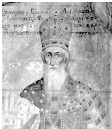
Андроник II Палеолог

Аланские наемники были разделены на три части. Их элитные отряды образовали под руководством Джиргона как бы личную гвардию Михаила IX. Остальные две пополнили контингенты византийской армии, в составе которой они год (согласно договору) воевали против болгар и турок. Эти сражения шли с переменным успехом. На востоке турки-сельджуки и османы все более усиливали давление на Византию. К 1302-1303 гг., после проигранных Михаилом IX сражений, положение оставшихся ее владений