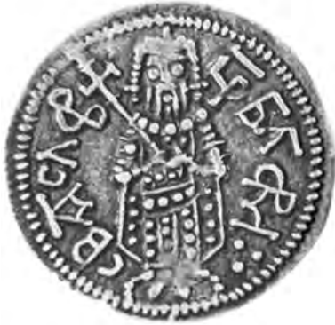
Монета Федора Святослава Тертера

А в это время победитель Ногая хан Токта вторгся в Болгарию. Ему нужна была лишь голова Чаки. Желательно отрубленная. Тогда Феодор Святослав велел удавить Чаку в Царевце, обезглавил и послал Токте его голову в подарок.