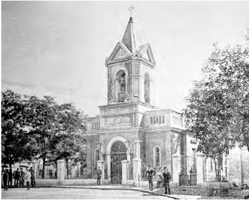
Армянская церковь на углу улиц Екатерининской и Базарной в начале 1890-х