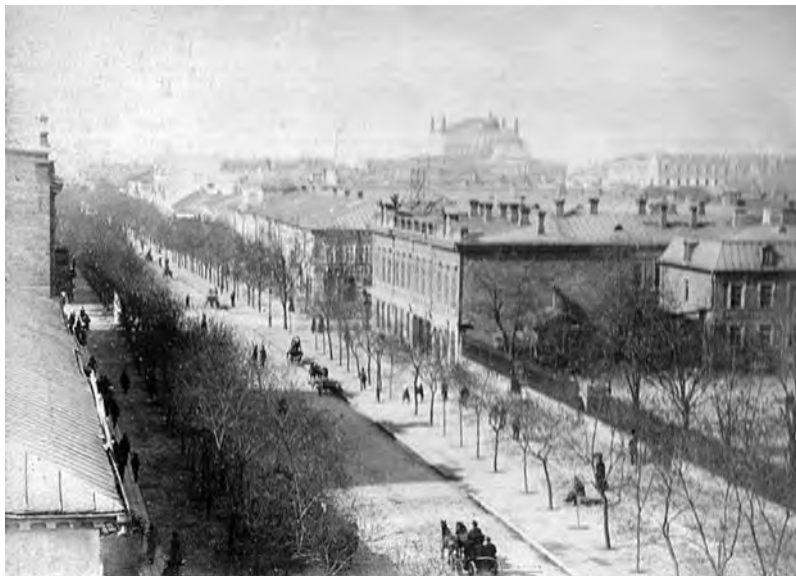
Вид на Екатерининскую улицу. Справа – ограда Католического храма. Конец XIX ст.