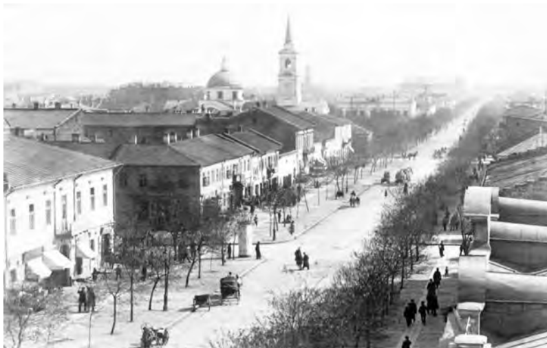
Вид на Екатерининскую улицу и Греческую церковь со стороны Еврейской улицы в конце XIX ст.

Вырисовывается общая картина ранней застройки. Начинаясь она как обычный жилой квартал. Ввиду концентрации здесь греческой недвижимости появилась возможность переноса прихода общины из периферийной Арнаутской слободки в более престижное, перспективное, да еще близкое к Старому базару, Красным рядам, главным магистралям место. Территория, принадлежащая строящемуся храму, была расширена покупкой смежных участков, что, меж прочим, позволило устроить участок для единичных погребений архипастырей. 971