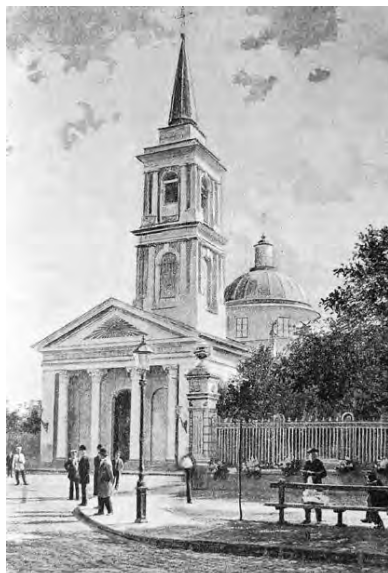
Греческая церковь в начале 1890-х