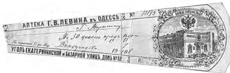
Сигнатура аптеки, размещавшейся в доме по улице Екатерининской, 62, угол Базарной