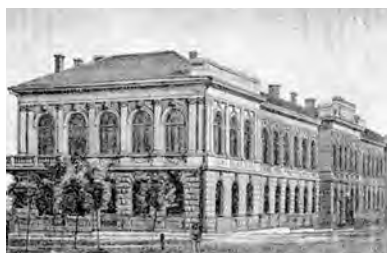
Старопортофранковская, 20. Вторая женская гимназия