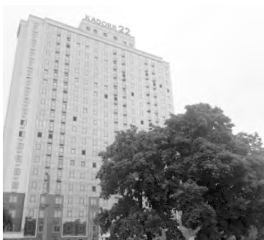
Алексеевская площадь. Здание, построенное в 2018 году на месте гимназии Ковриги