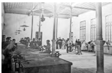
Старoportofранковская, 14. Городское ремесленное училище (ныне автомобильно-дорожный колледж)