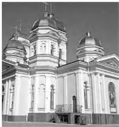
Алексеевский храм – двухклассное училище

пережило реконструкцию для Театра музыкальной комедии в 1940 году. Восстановление и реконструкцию для панорамного кинотеатра «Родина» в 1961-1963 гг. Реконструкцию в 2000-х годах. Сегодня это здание – довольно известный в городе кинотеатр «Родина».