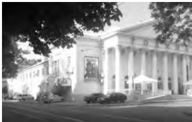
Современный вид, кинотеатр «Родина»

Образованием детей своей паствы занимались приходские церкви предместья: