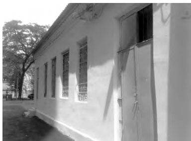
Мастерские бывшей гимназии Ковриги (современный вид)

Ковриги разместились 8-летняя школа № 13. В 1977 году было принято решение о ее объединении с нашей гимназией (тогда средней школой № 99), что находилась через дорогу по адресу Болгарская, 88 (тогда ул. С.М. Буденного). Здание бывшей гимназии Ковриги также передали средней школе № 99. В ее стенах обосновалась наша начальная школа. Через несколько лет из-за ветхости здания было принято решение перевести ставшую уже отдельной начальную школу № 99 на Старопортофранковскую (бывшее городское училище Эфрусси), где она находится и сегодня. А наша школа стала Одесской гимназией № 4 II и III ступеней. Вот каким образом сплелись истории гимна-