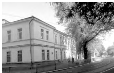
Одесская специализированная школа № 99 I ступени с углубленным изучением английского языка (современный вид)

ще Эфрусси), Старoportofранковская, 40. Семейство Эфрусси (богатейшие меценаты города) основало в Одессе училище, пожертвовав с 1868 г. более 62 тыс. руб. В 1881 г. император присвоил Одесскому 4-классному городскому училищу наименование «Городское училище Эфрусси». В 1900 году училище Эфрусси было уже 6-классным. В 2-этажном здании было 10 классных комнат, физический кабинет, раздевальная, приемная, учительская и канцелярия, рекреационные залы. Училищу принадлежал участок в 424 кв. саженей, во дворе – спортивные снаряды, двор постепенно обсаживался деревьями. В штате училища состояло 18 преподавателей, обучалось 533 ученика. Многие годы Игнатий Эфрусси, а затем Юлий Леонович