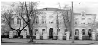
Ул. Старoportofранковская, 14. Современный вид