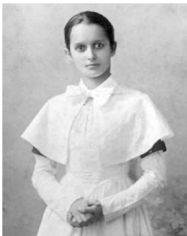
Форма гимназистов, II половина XIX века