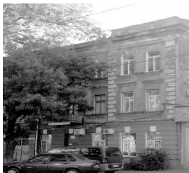
Степовая, 13. Училище госпожи Волковой