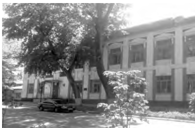
Железнодорожное училище (современный вид)