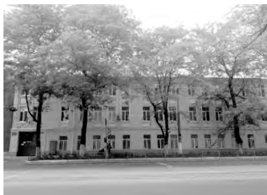
Прохоровская, 46, ОЗОШ 18

– Одесская общеобразовательная школа № 18 I-III ступеней на Прохоровской, 46 и 59. В 1905 г. это было Городское начальное училище № 21. В 20-х годах – семилетняя школа, после войны – 2-я железнодорожная школа, с 1961 года ОЗОШ №18, которая занимает по-прежнему два помещения.