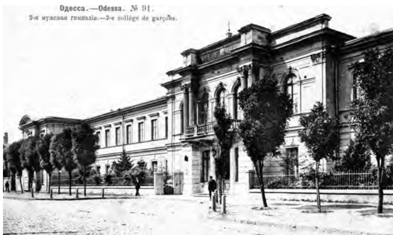
Старопортофранковская, 26. Вторая мужская гимназия