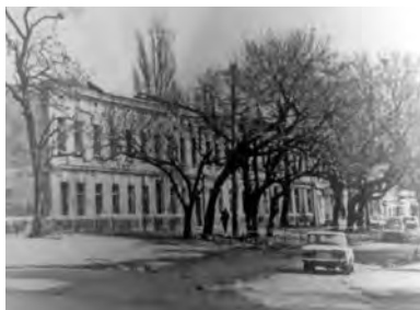
Алексеевская площадь. Здание бывшей гимназии Ковриги (фото 1996 года, здание снесено в 1998 г.)