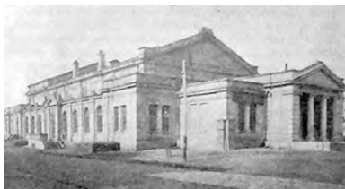
Мечникова, 104. Городская народная аудитория

столярному, токарному и другим. Плата за обучение – 20 рублей в год, \frac{1}{7} часть учеников освобождается от платы. По тому времени условия обучения ремесленников были идеальными. Кроме оснащенных по последнему слову техники учебных мастерских и кузни там имелись просторные классные комнаты, обширная библиотека, зала, спортивная площадка. В 1914 году в училище было 190 учащихся. 1929 – профшкола «Металл» № 3. 1982 г. – автомеханический техникум. Здание является памятником архитектуры и градостроительства местного значения.