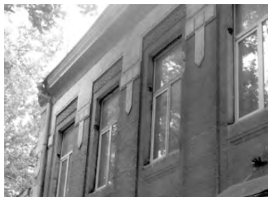
Госпитальная, 65..Женская гимназия Е. Висковатой