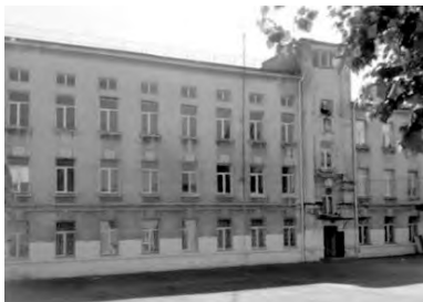
Староконный переулок, 9. Одесская специализированная школа № 21 I-III ступеней спортивного направления

– Одесская специализированная школа № 21 I-III ступеней спортивного направления по Староконному переулку, 9. Е.А. Прокудина 02.07.1904 г. подала прошение с проектом на постройку трехэтажного надворного здания под городское училище по Староконному переулку, 9. Проект утвержден в тот же день. В 1920 году по указанному адресу располагалась трудовая школа № 25.