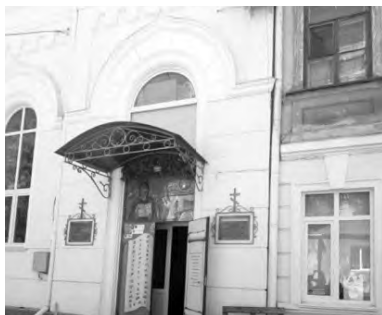
Храм Украинской православной церкви Одесской епархии Одесской семинарии Святых Мефодия и Кирилла (бывшее духовное четырехклассное училище, называемое «младшим классом»)

Городское ремесленное училище заложено в память 25-летия царствования императора Александра II, строительство: 1892-1896 гг. Открыто 01.10.1892, три основных и один подготовительный класс. Давало среднее общее и специальное образование по положению городских училищ от 1872 г. В училище обучается до 150 учеников. Обучались таким ремеслам: слесарно-механическому, литейному, кузнечному, малярному,