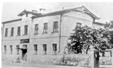
Старопортофранковская, 16. Железнодорожное училище (старое здание до реконструкции, фото 1900-х гг.)