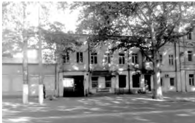
Госпитальная (Б. Хмельницкого), 32 Училище доктора Ландесмана