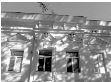
Прохоровская, 16. Реальное училище Ф.Н. Мякенко

Михайловская, 28 , – частный пансион для мальчиков господина Петровича (здание не сохранилось).