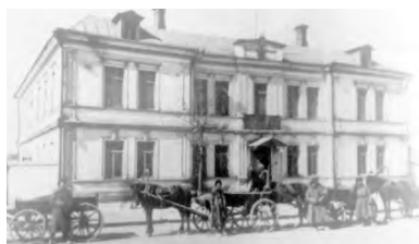
Старoportofранковская, 40. Городское училище Эфрусси (фото XIX века)

– Одесская специализированная школа № 99 I ступени с углубленным изучением английского языка (бывшее городское училище