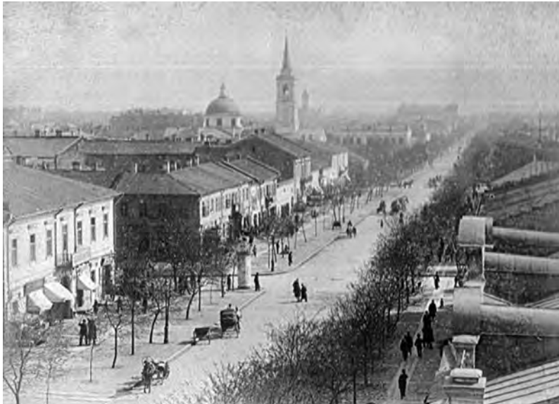
Екатерининская в XIX ст. Вид со стороны Еврейской на Греческую церковь

тельство нового Греческого храма на частных территориях было бы невозможно.