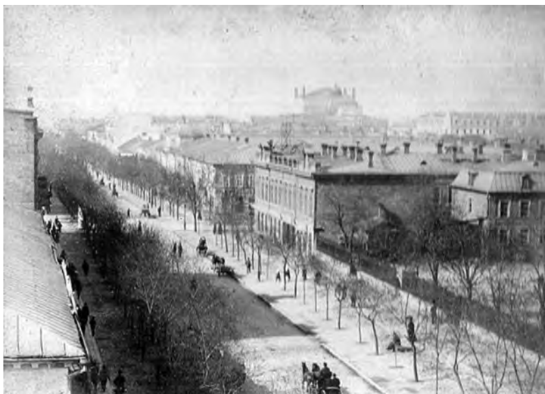
Екатерининская в XIX ст. Справа – ограда Католического храма

Чтобы было понятно, XXXIII квартал представлял собой прямоугольник, длинные стороны которого проходили по Троицкой и Успенской. Всего было восемь мест: по четыре в два ряда, то есть по Екатерининской и Ришельевской – по два места. При этом к 1803-му году основная застройка квартала отчетливо тяготела к Успенской, места № 297-300, где обозначено три довольно значимых строения. Со стороны Троицкой два места, о которых шла речь, и на плане показаны совершенно пустынными. Промежуточный № 302 включает лишь маленький флигель по красной линии. Угловой № 304 к Екатерининской тоже практически пуст, не считая небольшого флигеля посередине квартала Екатерининской, прямым на границе № 300, выходящего также на Успенскую и застроенного довольно солидным зданием в форме уголка. Чья это собственность (№ 304 и 300), я, к сожалению, пока не знаю; очевидно, кого-то из состоятельных греческих купцов, видных представителей общины; в противном случае строи-