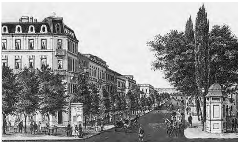
Дерибасовская угол Екатерининской