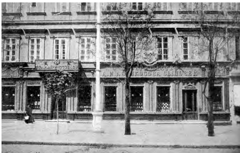
Магазин Товарищества А.И. Абрикосова сыновей