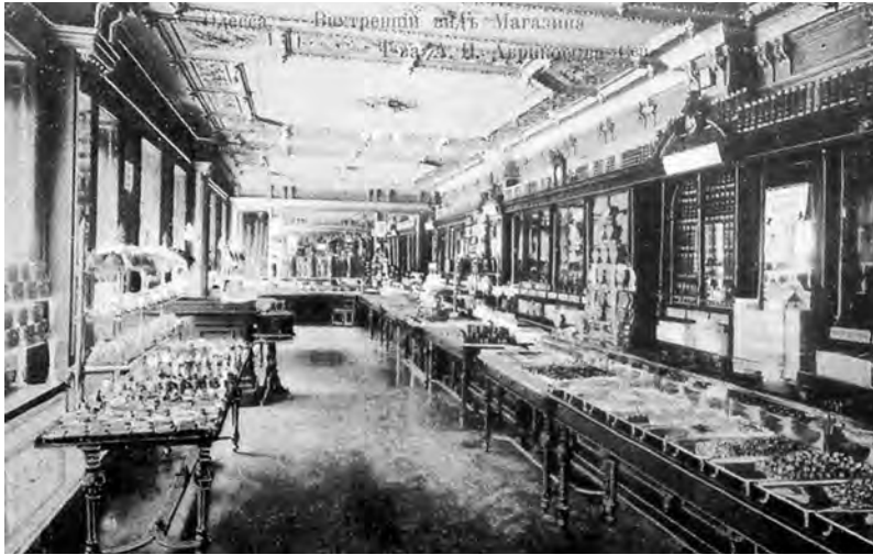
Внутренний вид магазина Товарищества А.И. Абрикосова сыновей

работы, делал на заказ жетоны, знаки, металлические печати, монограммы и др. 69