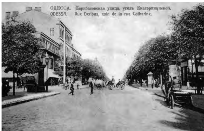
Дерибасовская улица угол Екатерининской

что до официального избрания присяжных маклеров (1803 г.) Калафати и некоторые другие греческие коммерсанты фактически занимались маклерством, разумеется, с выгодой для себя и в ущерб делу 6 . Претензии резонны, но иначе и быть не могло – это вполне естественный ход событий в процессе структуризации соответствующей инфраструктуры.