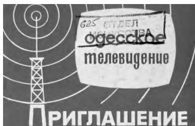
Пригласительный билет на торжественный вечер, посвященный 25-летию телевизионного вещания в Одессе. Октябрь 1981 г.

Жизнь идет вперед. Не многие теперь помнят день рождения телевидения в Одессе. Материалы, которые мы храним, напомнят вам его – 30 сентября 1956 года. Сколько энтузиазма было тогда у людей, осваивающих новое искусство! Представьте, в 1959 году здесь было создано творческое объединение «Одесса-Телефильм», которое до конца 80-х гг. выпустило