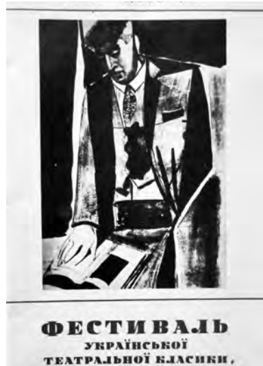
ФЕСТИВАЛЬ УКРАЇНСЬКОЇ ТЕАТРАЛЬНОЇ КЛАСИКИ.

Интересно перебирать папки, посвященные театрам Одессы. Когда-нибудь станут редкостью билеты на детский утренний спектакль в Театр музыкальной комедии 1982 года. Можем свидетельствовать, что участники первой одесской команды КВН, журналисты, писатели, врачи и педагоги в 60-70-е гг. были активными зрителями этого театра. Не исключено, что сохранившиеся билеты связаны уже с походом в театр одного из этих театралов