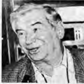
("Целуй меня, Кат!") и заканчивая "одесскими историями" (трилогия об Одессе). Наверное, все