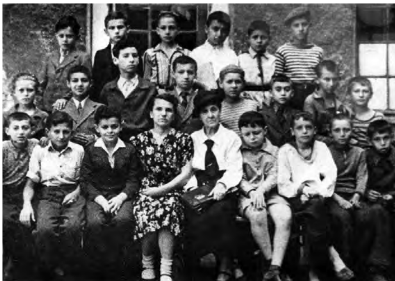
Выпускной четвертый класс. Я правее учительницы, имя, отчество и фамилию которой никак не могу вспомнить. Может, читатели помогут?

Конечно же, поразили деревья, цветы, я не знал слово «субтропики», но после знойного сухого Ташкента природа в Сочи, особенно в санатории, казалась чудом. В санатории была еще довоенная библиотека. И новые книги, которые я читал, – «Хижина дяди Тома», «Робинзон Крузо», чеховская «Каштанка», заставляли