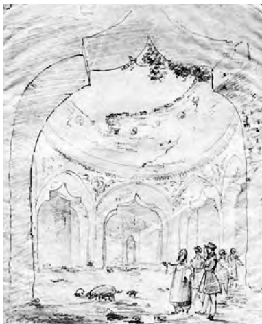
Руины архаичной «турецкой бани» Рисунок К. Боссоли, 1838 г.

Согласно контракту, Автомонов получал неоспоримое право содержать эту баню в течение пяти лет, причем за первый год