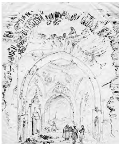
Руины архаичной «турецкой бани» Рисунок К. Боссоли, 1838 г.