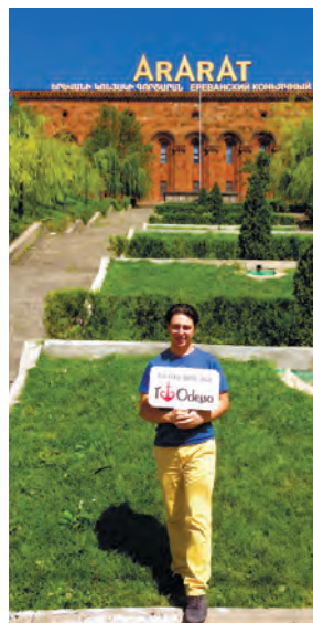
Мы любим Одессу везде и всегда