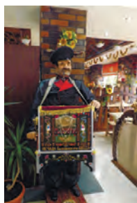
Этот шарманщик – одессит с Балковской, 41