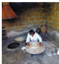
Лаваш пекли на наших глазах