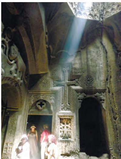
Луч света осветил хачкар в скальной церкви Гехард