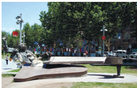
За роялем – Арно Бабаджанян