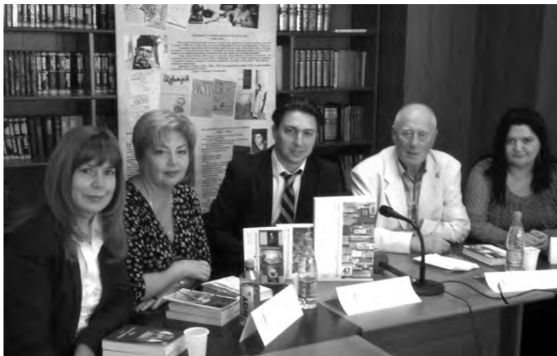
Презентация «Одесской библиотеки» в Славянском университете

привлечения инвестиций и туристов из разных стран. В рамках дискуссии мы стремились помочь коллегам советами, делились опытом, который мог бы способствовать в деле продвижения своих территорий на мировом туристическом рынке.