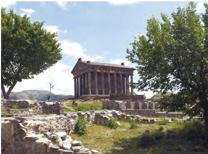
Храм Гарни был посвящен богу Солнца