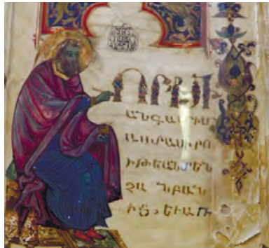
Памятник Месропу Маштоцу и одна из рукописей Матенадарана