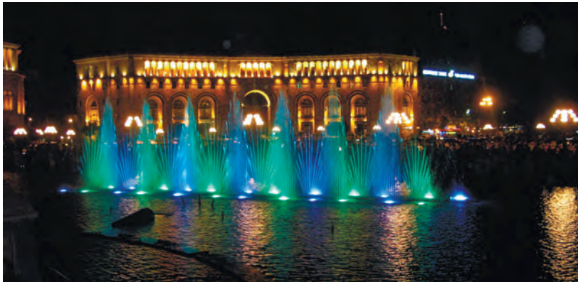
Поющие фонтаны на площади Республики