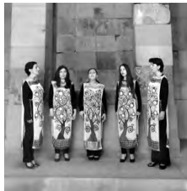
На разных языках – о духовности

Под сводами храма звучат старинные армянские песнопения: несколько женщин в стилизованных одеяниях своими дивными голосами опрокидывают нас в глубь времен.