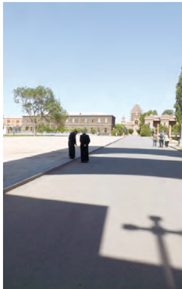
В Эчмиадзине хранится копье Судьбы