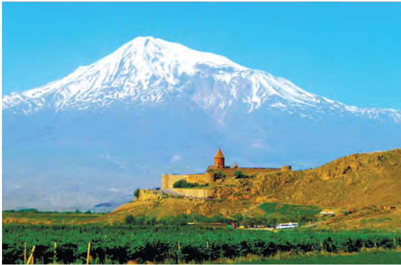
Священная гора Арарат – вид с границы с Турцией