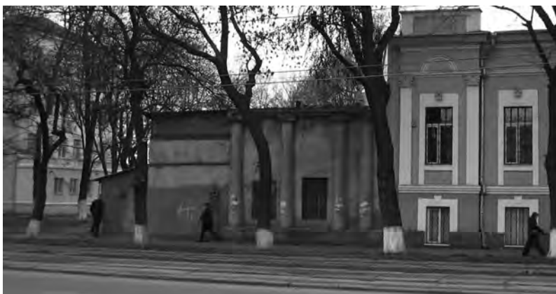
Так выглядят теперь ворота 1-го Еврейского кладбища

лировках кратких, но точных, оно присутствует в предисловии, написанном Михаилом Пойзнером. Не однажды оно проступает в сопутствующих основному тексту замечаниях Смирнова и Губаря. Авторы оказываются вполне на уровне той сложной и драматически деликат-