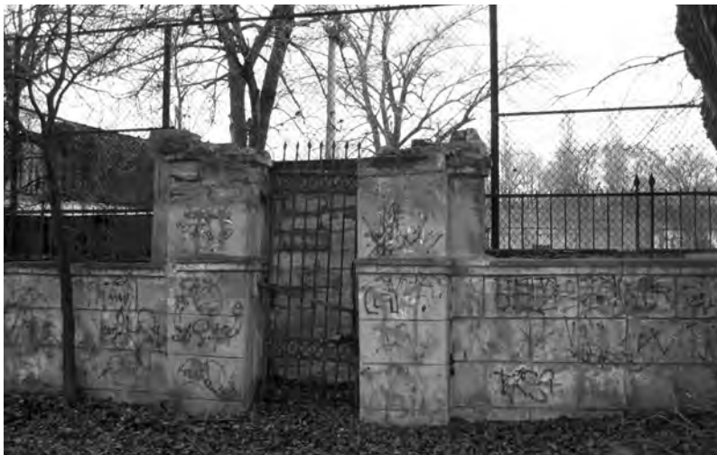
Сохранившийся забор, отделявший христианскую часть кладбища от иноверческих, с калиткой