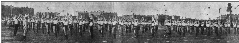
Болгары-юнаки на Куликовом поле в Одессе

пасхальных развлечений для рекламирования мероприятий и привлечения публики.