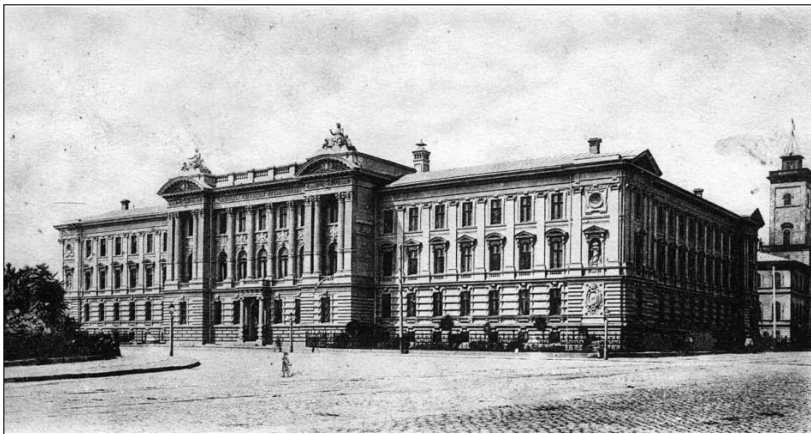
Здание судебных учреждений

Строительство солидного здания пассажирского вокзала значительно облагородило и изменило этот район. Мощное сооружение, именуемое в документах "пассажирское здание "Куликово поле", возводили по конкурсному проекту петербургского зодчего В.А. Шретера под надзором одесского архитектора А.О. Бернардацци с 1879 по 1883 год. Вокзал занял большую часть огромного Куликова поля и рассек его на три площади: Куликова поля в нынешних его размерах, примыкающую к Привозу Сенную площадь и сформировавшуюся несколько позднее Привокзальную (Гюремную) площадь.