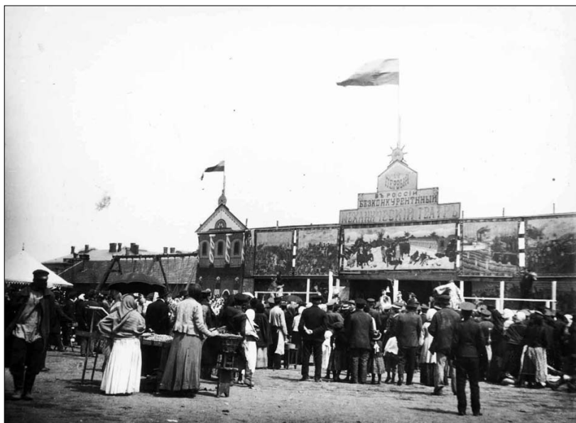
Балаганы на Куликовом поле