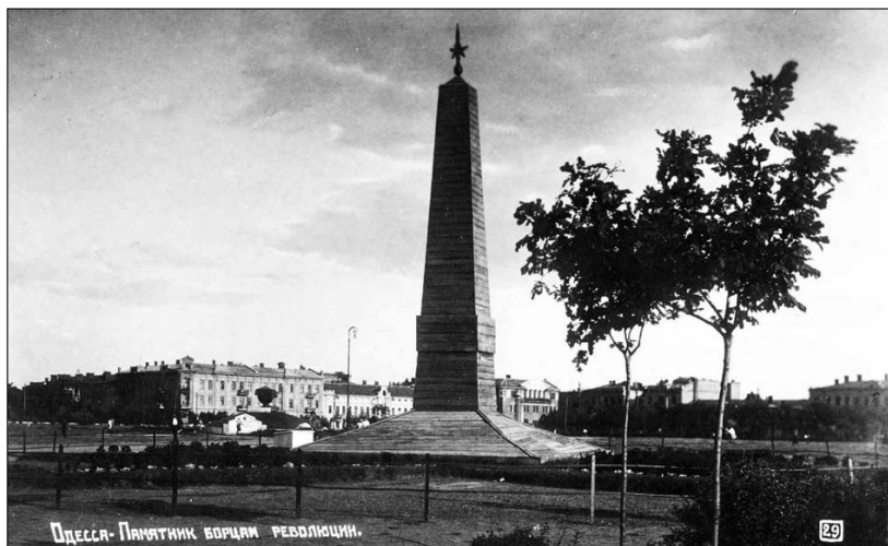
Памятник Борцам революции

До сих пор открыток с видом Павловских зданий дешевых квартир коллекционерам известно не было. Снимок сделан, скорее всего, осенью 1918 года, во время немецко-австрийской оккупации Одессы. Австрийские фотооткрытки этого смутного времени с одесскими сюжетами, снабженные печатью "Feldpost 240", хорошо известны. Немецкие же работы до сих пор не попадались одесским коллекционерам. Учитывая, что номера этой серии превышают сотню, нас еще ждут впереди новые находки.