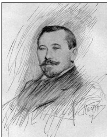
П.А. Нилус Рисунок Л.О. Пастернака