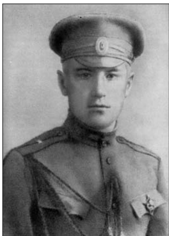
Валентин Катаев. 1916 г.