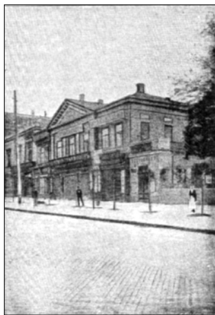
Городской дом по Дерibasовской улице, где основалась фабрика в 1829 г.

После передачи сада городу Ришелье дальновидно пригляделся к смежным с подаренным садом земельным участкам и сделал заключение о том, что территория зеленого массива в самом центре юного города может быть значительно умножена за их счет. Во-первых, можно было использовать проезжую часть и тротуары целого квартала намечающейся Ланжероновской улицы, в промежутке Преображенской и Гаванной, а кроме того, "дворовые места", примыкающие к казенным зданиям со сто-