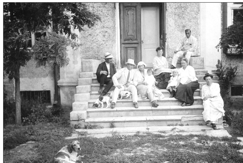
В Степановке. 1913 год

По указу его императорского величества Херсонская духовная консистория на основании определения состоявшегося в сей консистории 3-го декабря 1913, надлежащею подписью, с приложением казенной печати, удостоверяет, что в шнуровой метрической книге Единоверческой Успенской церкви города Одессы Херсонской епархии за 1888-й год, в архиве консис-