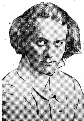
МОЗЖУХИН. К его возвращению в Россию и предстоящим кино съёмкам в Одессе.