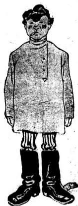
...затейливо расчесанный парень в бумажной рубашке навыпуск...

— Могу ли я, сударыня, — с достоинством начал Куковеров, но старуха прервала его и с улыбкой, полной величия и покоя, протянула ему анкету, написанную по-французски.