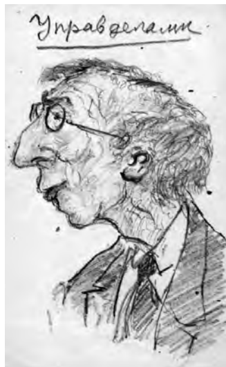
Зарисовки к последней пьесе