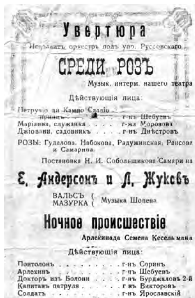
Программа спектакля в театре Соболевцова-Самарина. 1917

Ах, господа, жизнь проще и ясней Напева музыкальной табакерки, Когда друзья и девы вешних дней Сияют в лаке этажерки...» 58