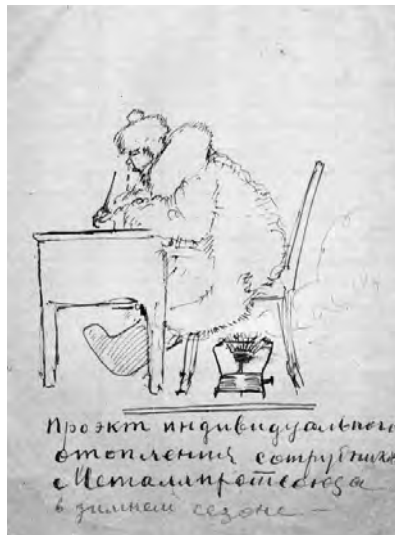
Карикатуры 1920-30-х гг.