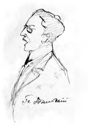
П. Пильский. Рис. С. Кесельмана

с Леонидом Баткисом и Владимиром Овчаренко, бывшим одноклассником Кесельмана. Скорее всего, он и пригласил Кесельмана участвовать в сборнике. «Солнечный путь» отпечатан изящно, на хорошей бумаге, обложка украшена рисунком художника М. Гершенфельда. Но сборник отличается крайней эклектичностью, погоней за «знаменитостями» любых направлений. Представлены 27 авторов: случайные столичные (К. Бальмонт, С. Городецкий, Г. Иванов, Н. Клюев), а также одесские поэты — разных поколений (от А. Федорова до А. Биска), разного дарования, просто дилетанты. В резко отрицательном отзыве Г. Цагарели на сборник «Солнечный путь» похвалы удостоились