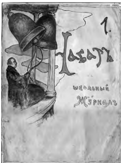
Обложка школьного журнала. 1906