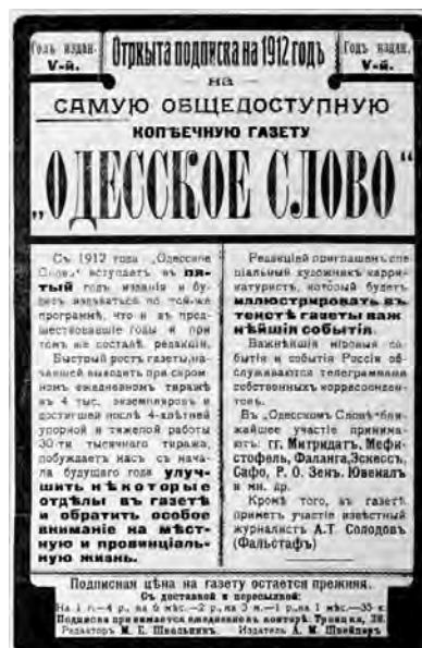
Объявление в газете «Одесское слово»