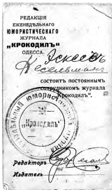
Удостоверение сотрудника «Крокодила»

Вероятно, с началом 1910-х связана история с письмом, будто бы полученным Кесельманом от Александра Блока; об этом письме упоминали в своих воспоминаниях В. Катаев и Ю. Олеша. Катаев: «Я думаю, он считал себя гениальным и носил в бумажнике письмо от самого Александра Блока, однажды похвалившего его стихи» 26 ; Олеша: «...был еще в Одессе поэт Семен Кесельман, о котором среди нас, поэтов более молодых, чем он, ходила