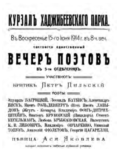
Афиша первого «Вечера поэтов»