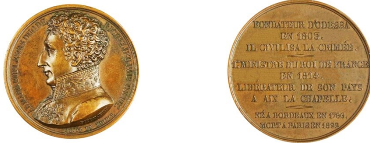
Медаль в память дюка де Ришелье. Лицевая и обратная стороны.