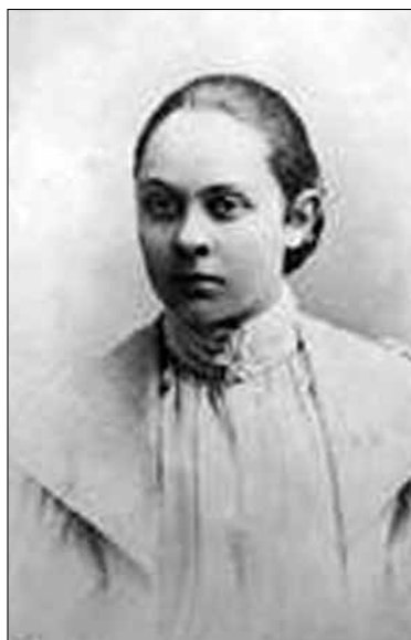
Д.А. Галюзман. 1898 г.