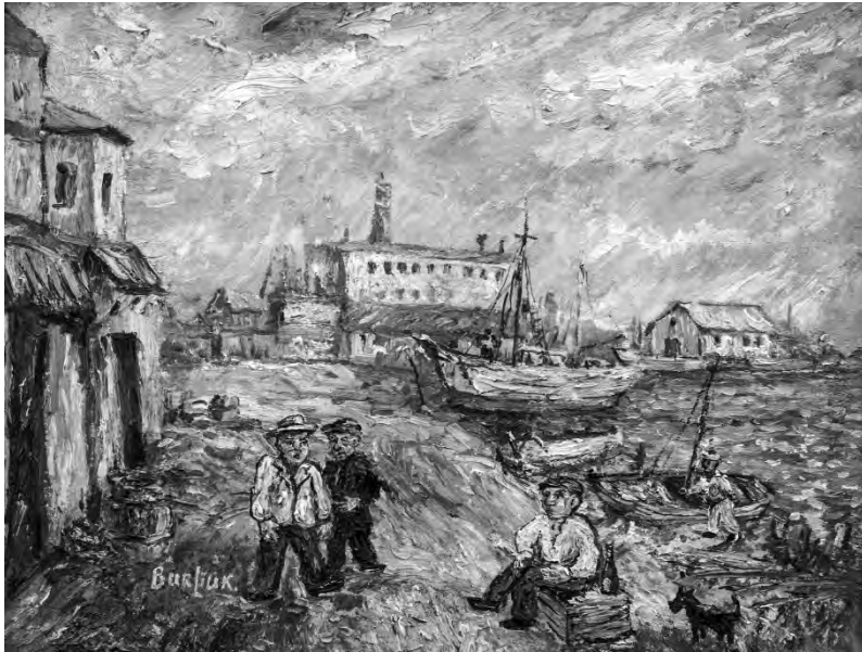
«Трое с собакой возле причала». 1950-е гг. Холст на картоне, масло, 35,4×45,5 см Частная коллекция

«Особенный успех сам собою выпал на долю произведения самого лектора (Давида Бурлюка. – Прим. авт. ) и его не менее одаренного брата. Очень понравился портрет г. Пильского кисти Владимира Бурлюка. Писанный по-футуристски. Не кистью, брандспойтом. И изображавший не Пильского, а пирамиды под снегом. Очень удачный портрет».