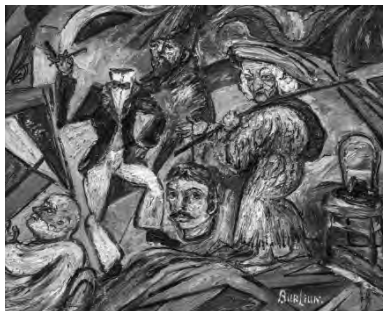
Кубофутуристическая композиция «Скоротечность бытия». 1950-е гг. Холст на картоне, масло, 40,4х50,4 см Частная коллекция