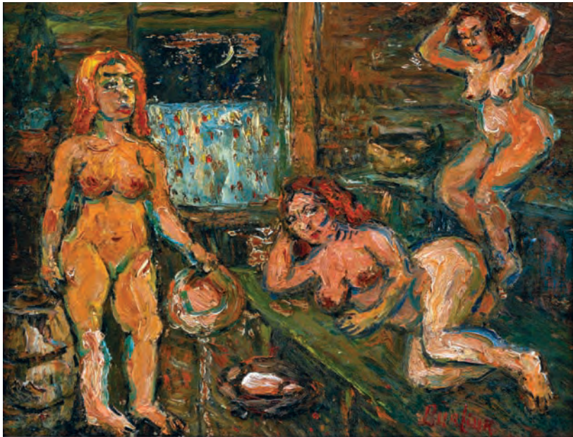
«В бане». 1940-е гг.