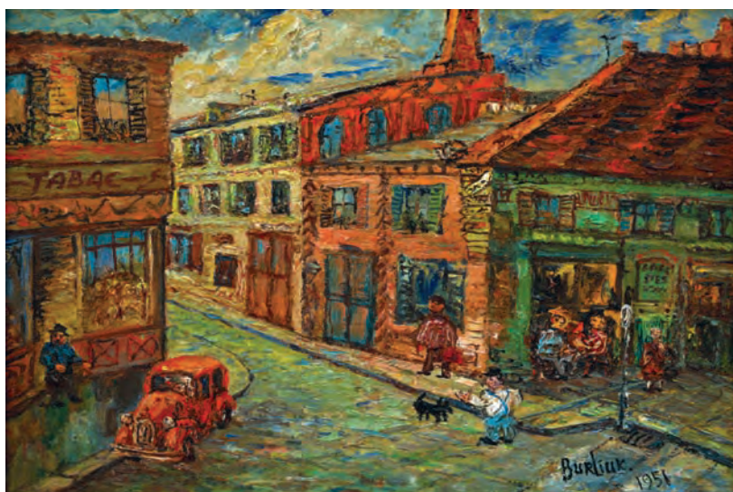
«Улица Нью-Йорка». 1951 г.