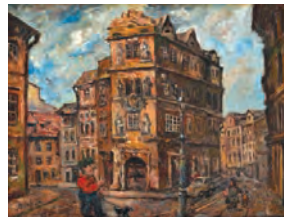
«Прага». 1957 г.