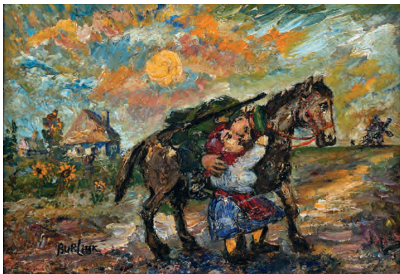
«Казак уходит на войну». 1960-е гг.