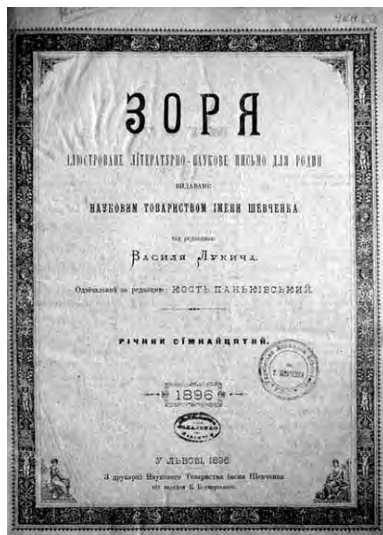
Журнал «Зоря» № 20, 1896 г.

Письмо датировано 1896 годом и написано после посещения Одессы. Гастроли летнего сезона 1896 года «Товарищества русско-малороссийских артистов под управлением А.К. Саксаганского» начались в Николаеве (27.03 – 19.04) и продолжились в Одессе (21.04 – 5.05) 2 . Письмо написано до страстной недели, которая в 1896 году приходилась на период с 18 по 24 марта. Скорее всего, Саксаганский посетил Одессу не в период гастролей, а во время отдыха от представлений в феврале – начале марта 1896 года. Тогда же и было написано письмо.