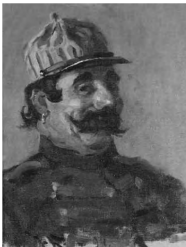
П.К. Саксаганский в роли Харька Ледачего в пьесе «Паливода XVIII столетия» И. Карпенко-Карого

Под этим названием драма была поставлена на сцене. Премьера ее состоялась в 1897 году в Херсоне и 3 декабря этого же года с большим успехом была показана в Одессе. «Одесская газета» в отзыве на спектакль писала: «...новая пьеса г. И.К. Тобилевича... очень красива в исполнении, блещет роскошью костюмов и разыграна труппой образцово». 7