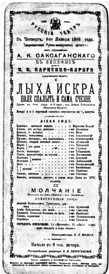
Афиша 1898 г. Кировоградский краеведческий музей

из Петербурга, как и предполагалось, перед Пасхой. В письме к своему другу художнику В.Д. Поленову, отправленном из Одессы 4 апреля 1896 года, он упоминает о своем спешном отъезде из Петербурга в связи с болезнью. 4