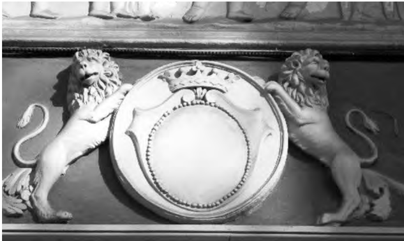
Композиция со львами и короной над входом в здание Одесского художественного музея

Над дверью парадного входа во дворец есть еще одно гербовое изображение: два льва держат щит, увенчанный короной. Поле щита пустое. Возможно, изображение утрачено, но возможно, и сохранилось под многими слоями краски. В любом случае, это, несомненно, герб Нарышкиных. Но что интересно, короны на гербах Любич и Нарышкиных, которые находятся на здании, идентичны. При более детальном осмотре герба Юрьевичей (с использованием фотооптики) стала заметна неоднородность поверхности мрамора: некоторые участки тщательно отполированы, в то время как другие участки не столь ровны и даже имеют выбоины, похожие на следы от инструмента. Если условной линией отделить гладкую поверхность от поврежденной, четко обозначатся контуры львов, стоящих на стилизованной траве и держащих щит с одноглавым орлом и решеткой. И все прояснилось.