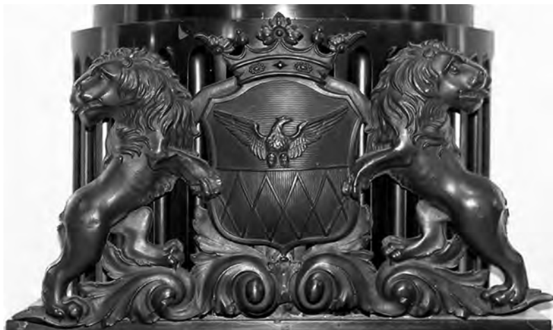
Герб рода Нарышкиных

в верхней в голубом поле виден до половины черный одноглавый орел. В нижней части в красном поле золотая решетка. Щит увенчан обыкновенным дворянским шлемом с дворянскою на нем короною и тремя страусовыми перьями. Намет на щите голубого и красного цвета, подложен золотом. Щит держат два льва».