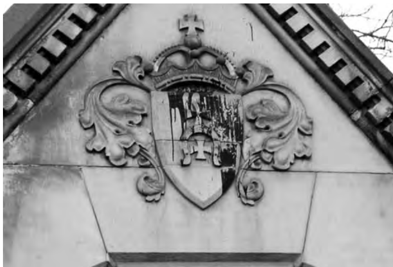
Герб Любич на фамильном склепе Юрьевичей. Новое кладбище. Одесса