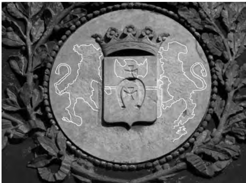
Герб на фронтоне здания Одесского художественного музея с наведенными контурами элементов герба Нарышкиных

и двух кавалерских крестов. Что двигало богатейшим человеком, мы, наверное, уже не узнаем. Но, как говорят в Одессе, он явно сэкономил.