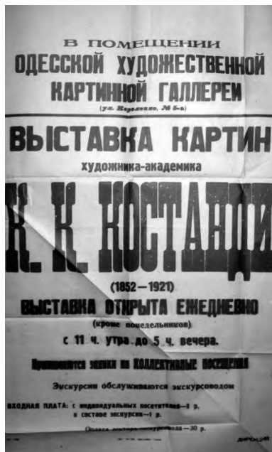
Афиша выставки картин К.К. Костанди в Одессе. 1946 год (ГАОО ф. Р-5585 оп. 1, ед. хр. 17)