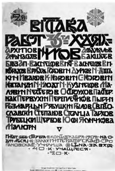
М.А. Врубель. Афиша II выставки 36-ти художников. Москва. 1902