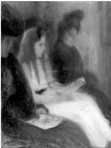
Л.О. Пастернак. «На концерте» Одесский художественный музей