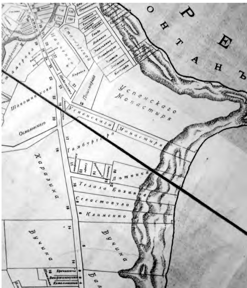
Фрагмент карты «Черноморское побережье. «Швейцария» дача Ковалевского» издания издательства «Одесские новости» составителя К.В. Висковского с обозначением участков дач Костанди и Вучины

про «забытую». – Так пожалуйста, дорогой мой, сейчас же высылайте непременно – на мой счет, конечно!