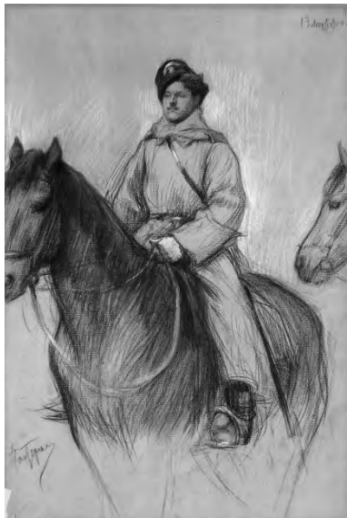
Л.О. Пастернак. «Казак» Одесский художественный музей

лать, я согласился, ведь от Одессы нельзя требовать тех цен. Жалко «Концерт», не продан, ужасно неудобно его назад отсылать – разобьют, испортят, большая пастель слишком и везти неудобно. *** Да! Выставка, вероятно, если не закрылась, то верно закроется на днях, а потому пожалуйста, сообщите моему брату (Базарная, 66), **** чтобы он прислал за вещами, ибо я боюсь, чтобы от Вас их отравили: опасно со стеклами, и у Вас при массе отправок артельщик не так отнесется, как на свободе это сделает мой брат сам. Но только за отсылку вещей я потребую с Вас, т. е. с товарищества – а то за год много набирается разных «пересылочных расходов» и проч.